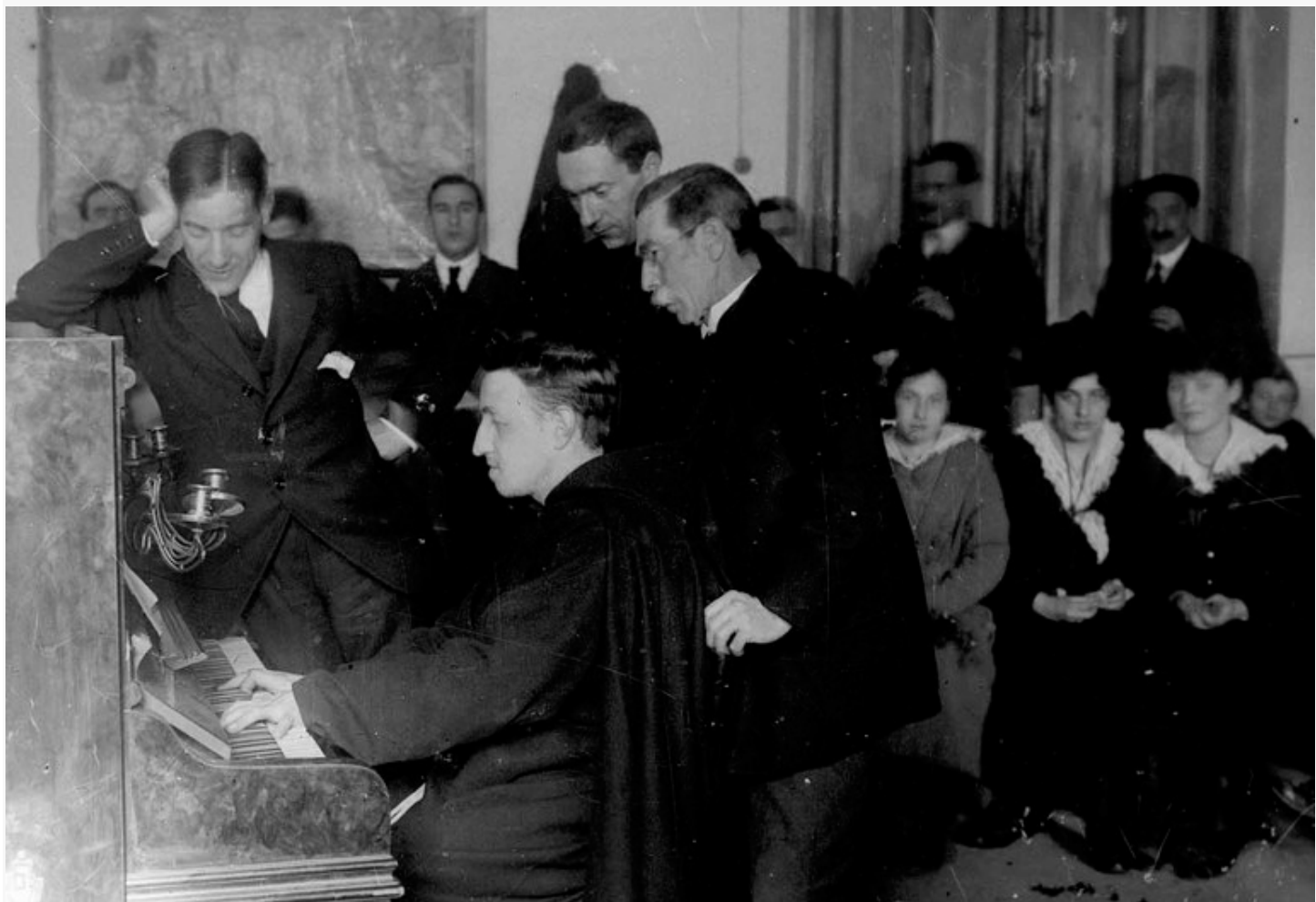
Aita Donostia piano jotzen (Eibarren 1917an) / El Padre Donostia tocando el piano (en Eibar en 1917)